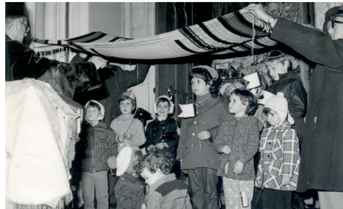
Szimchász Tajró ünnepség körzetünkben (1970-es évek vége)

back”-et, azaz egy visszacsatolást. Ez pedig nem más, mint egy üzenet magunk felé, hogy ha hibáztunk is, mostantól majd figyelünk rá, hogy ne tegyük meg még egyszer!