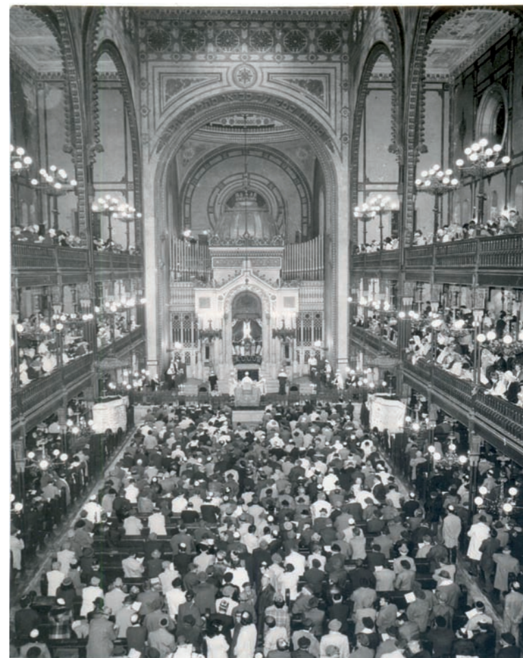
Nagyünnep a Dohány utcai zsinagógában (1970-es évek vége)

Én pedig úgy hiszem, hogy igen! Igen, fontos a bocsánatkérés. Fontos azért, mert ha őszintén tesszük azt, akkor jobb lesz talán nekünk is, jobb lesz a lelki nyugalmunknak és őszinteségünk jeleként talán annak is, akiket akartunk, akaratlanul szavainkkal, tetteinkkel megbántottunk! És ami a legfontosabb üzenete lehet ennek az előírásnak vagy szokásnak az az, hogy a bocsánatkérés mindnyájunk számára tartalmaz egy, a mai szóhasználatnál élve, „feed-