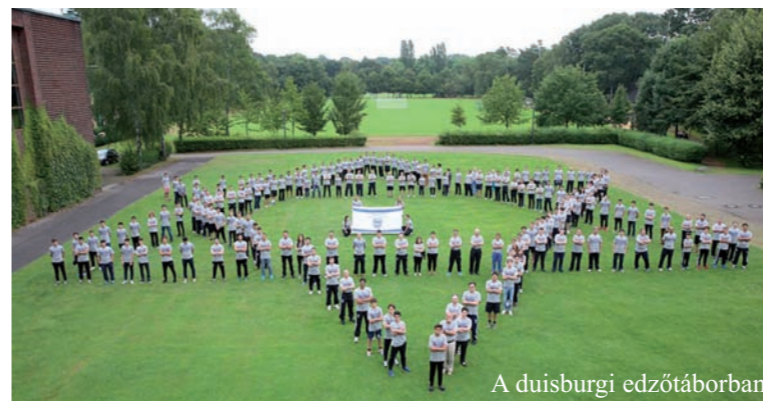
A duisburgi edzőtáborban

Bár a pontos program még nem ismert, azt már most tudni, hogy a megnyitónak a Waldbühne ad otthont. Az is ismert, hogy a szervezők lényegesen többet szeretnének, mint „csupán” versenyeket. Lesznek kulturális programok, amelynek keretein belül, augusztus 2-án egy nagyszabású – rasszizmus és antiszemitizmus elleni - koncertet rendeznek számos ismert fellépővel és sportolóval.