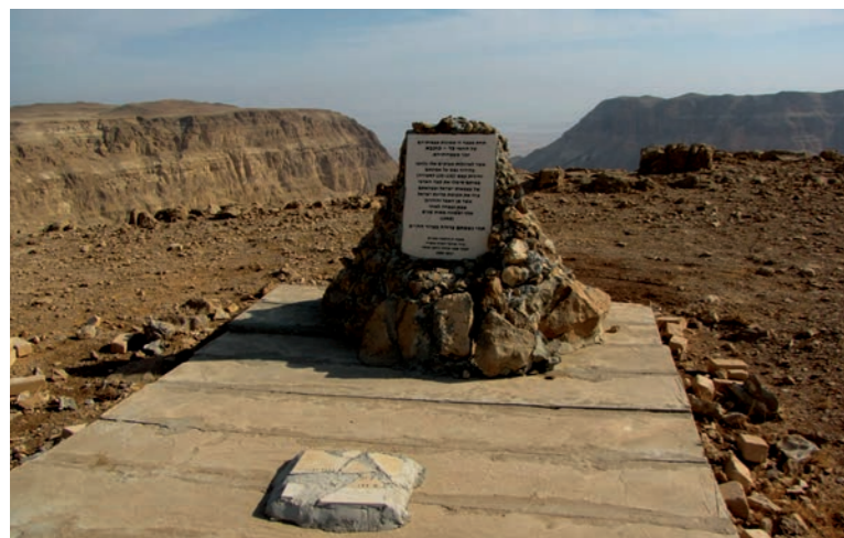
Emlékmű Bar-Kochba hős katonái tiszteletére a Júdeai-sivatagban, Nahal Heverben

Tórai parancs, hogy a Peszách másnapjától kezdődő ötven napot számláljuk. Hét teljes hetet, 49 napot kell számolnunk. Ez az oka, hogy minden este, a számlálásnál nemcsak a napokat, de a heteket is számoljuk, pl: ma van a hetedik nap, amely egyúttal egy hete is az ómernek.